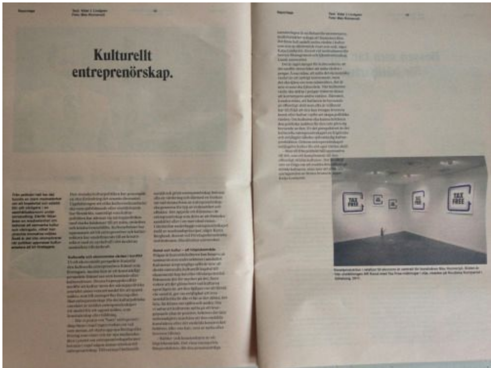
Tax Free paintings in Stockholm Banco